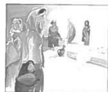
Bild 7: Maria Magdalena erkennt ihren toten geglaubten Freund Jesus wieder

Im Rückblick erinnern sich die Kinder an die Handmassage. Heutiger Liebesdienst: einander sorgfältig den Rücken abklopfen.